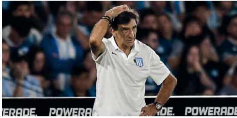
Cuestionado. Costas se juega su cargo en Mar del Plata.

Racing llega a este encuentro en un muy flojo momento, ya que perdió en tres de sus últimas cua-