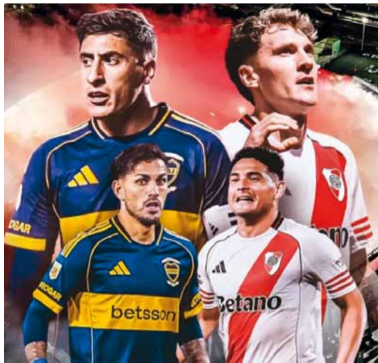
Electrizante. Una nueva edición del Superclásico en el Monumental.

River y Boca sufrirán ausencias de peso producto de sus participaciones internacionales. El miércoles, en el mano a mano con los venezolanos, se lesiona-