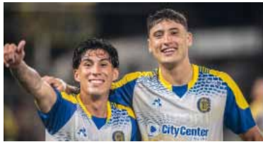
Un nuevo paso hacia los playoffs.