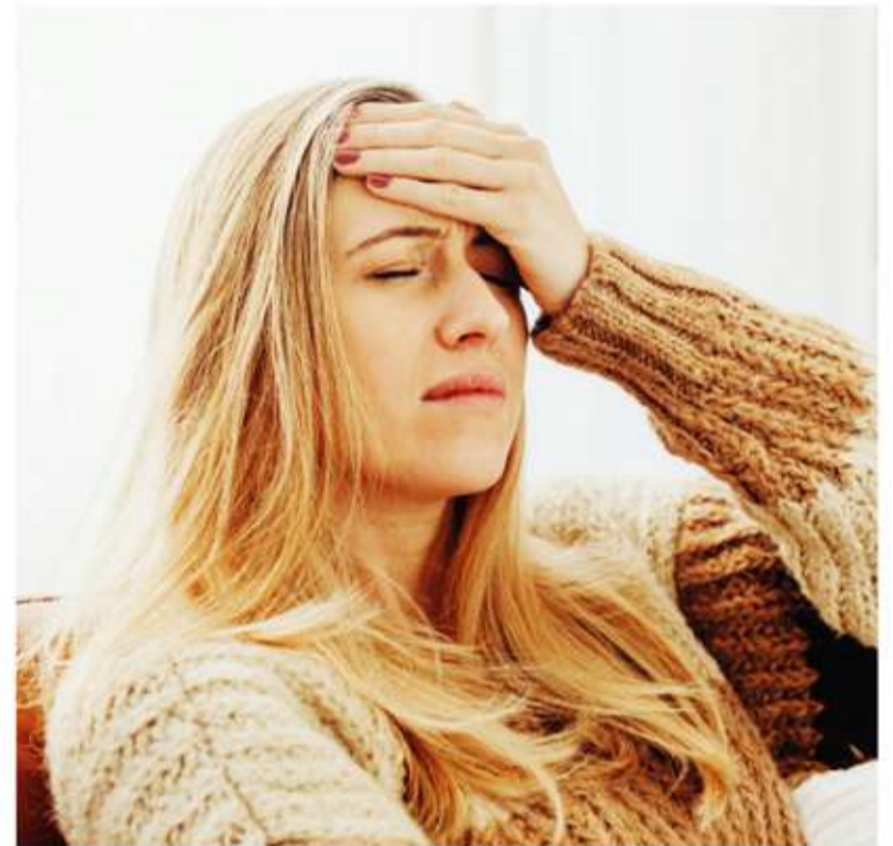
Enfermedad prevalente. La migraña afecta a una de cada diez personas en el mundo.

"El impacto funcional de esta enfermedad en la vida diaria también es un indicador muy importante. Cuando el dolor obliga a frenar todo, cancelar actividades o compromisos, ausentarse al trabajo o estudio, apagar la luz y acostarse, eso ya habla de un nivel de discapacidad que merece ser evaluado.