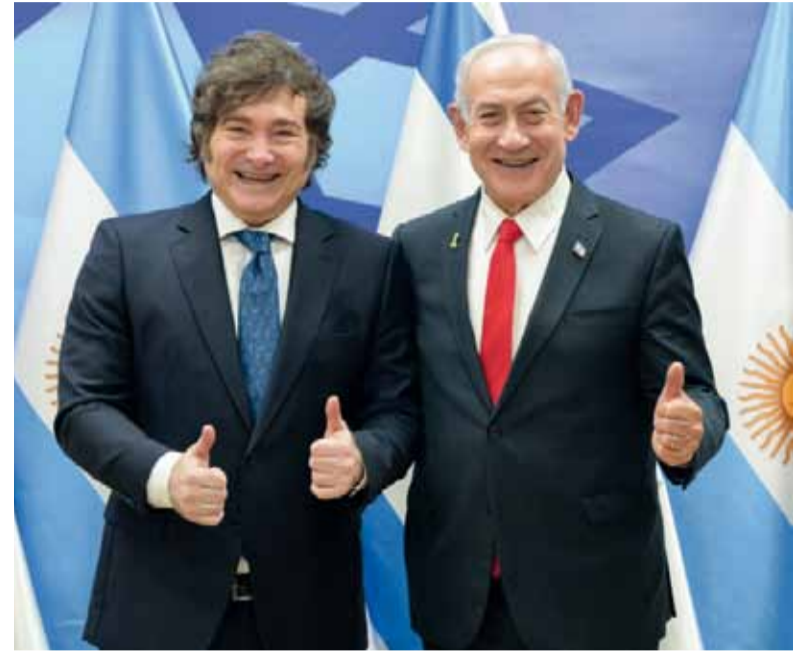
Aliados. El presidente argentino junto al primer ministro Benjamin Ne-

En paralelo a la gira, Milei reforzó su alineamiento ideológico con Israel en una entrevista concedida a un medio local. Allí