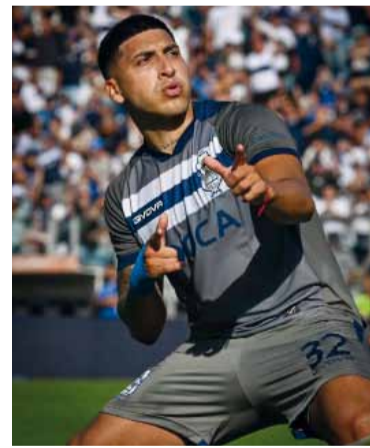
Torres sacó la metralleta.

El Lobo se mostró sólido en defensa en el complemento y neutralizó a Estudiantes, que no logró inquietar a Nelson Insfrán. El partido perdió intensidad: Gimnasia apostó a la contra y la visita al juego aéreo, pero la firmeza local sostuvo la ventaja. Con este resultado, Gimnasia logra escalar posiciones en la