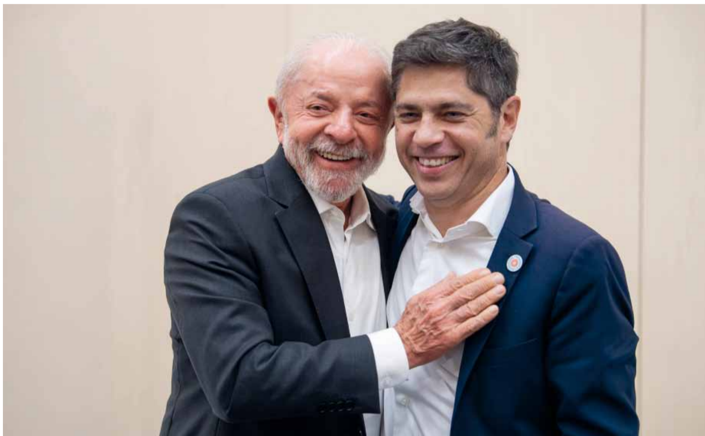
El gobernador junto al presidente de Brasil en una reunión clave para mostrar el contraste con la política internacional del Gobierno nacional.

el primer ministro Benjamin Netanyahu, participará de los festejos por la independencia israelí y recibirá reconocimientos institucionales, en una visita que refuerza su alineamiento con el gobierno israelí. Página 3