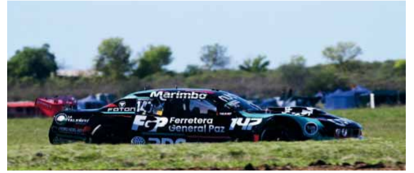
Voló. El cordobés al volante del Dodge Challenger del Galarza Racing.