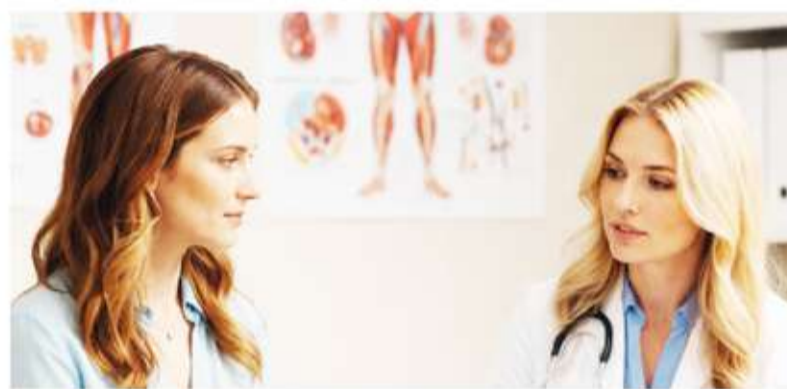
Diferencia. La mayor parte de las víctimas de la migraña son mujeres.