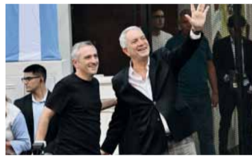
Perdón. "Si nos vamos a recriminar errores, no habrá unidad", señaló el jefe comunal.

El jefe comunal propuso avanzar hacia un "frente patriótico bonaerense" con el objetivo de pro-