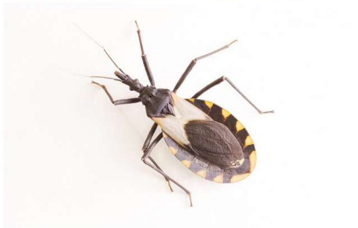
Endémico. Un gran problema con el chagas es que pueden pasar años antes de que haya síntomas.

Según un estudio difundido por la Mayo Clinic, en su fase crónica la en-