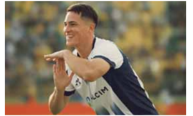
La T quiere sostener su rendimiento.