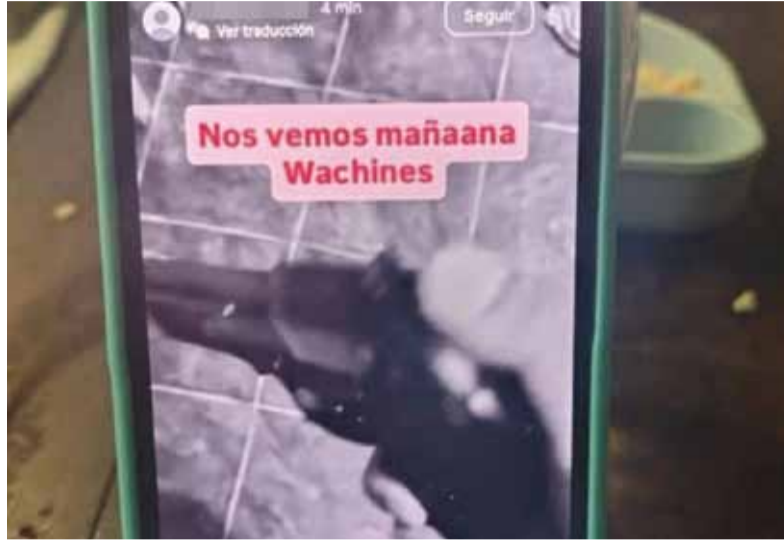
En San Miguel. La amenaza que aparecía en la cuenta de Instagram que después fue cerrada.

El denunciante aportó las capturas de pantalla y los investigadores constataron la existencia de las cuentas que luego fueron cerradas, pero luego profundizaron las diligencias